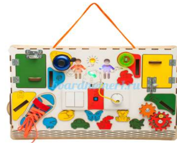
Бизиборд классический со светом и магнитами (56x37x7.5).