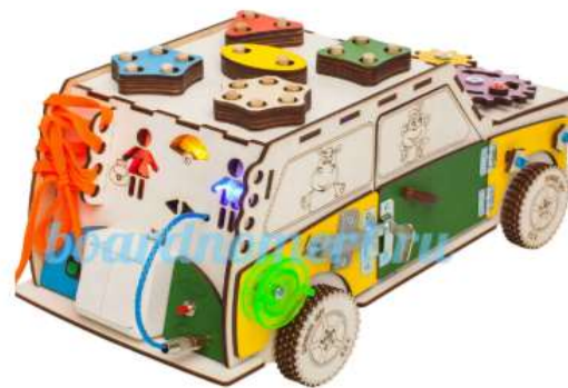
Бизи-машина со светом (40x20x20)