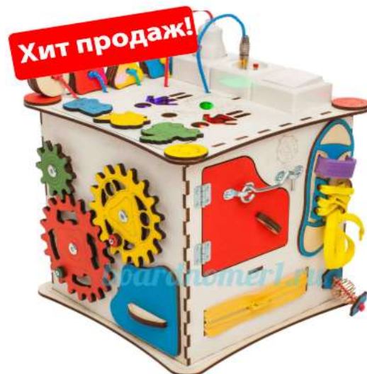
Бизи-куб со светом (25x25x25)