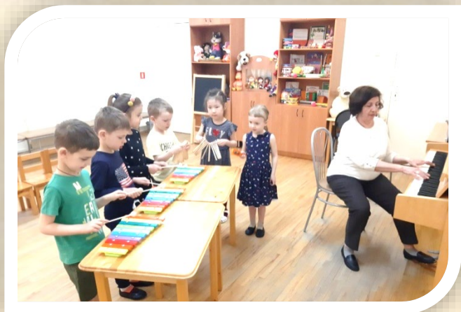
Старшая группа. Ансамбль

С помощью активного использования музыкальных инструментов в работе с детьми, у них успешно формируются умения и навыки, необходимые для осуществления различных видов музыкальной деятельности