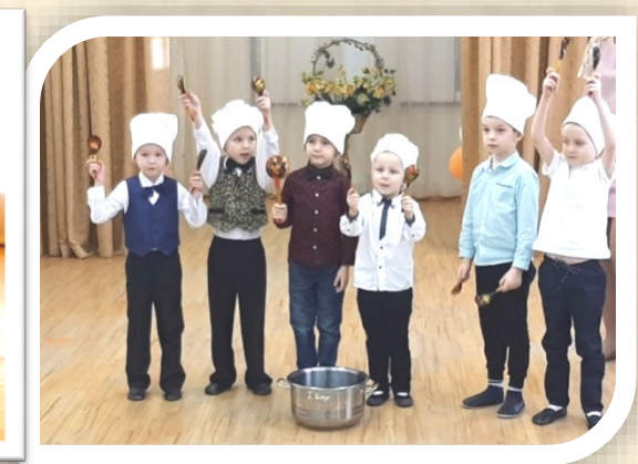
Старшая группа «Танец поварят»