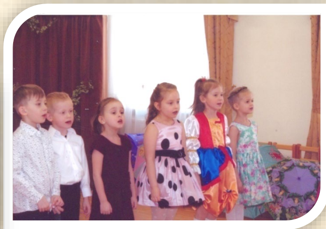
Старшая группа. Песня про дождик