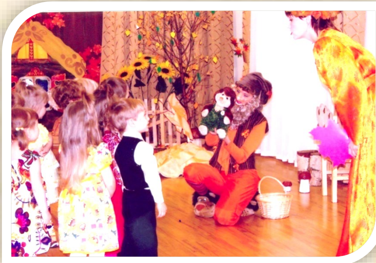
Добрый гном в гостях у малышей

Дети любого возраста с удовольствием встречают сказочных героев