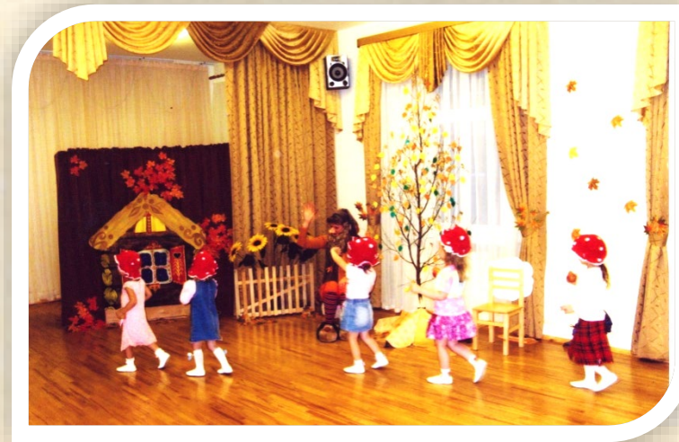
Младшая группа «Грибочки»