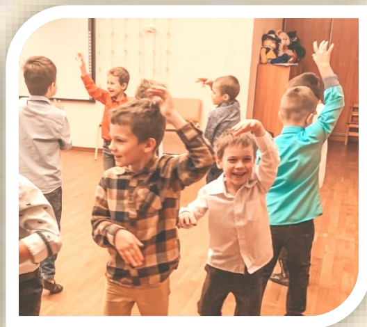
«Лесные жители» ...на месте замри...