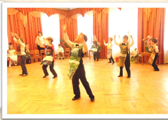
Подготовительная группа. Танец «Стирка»