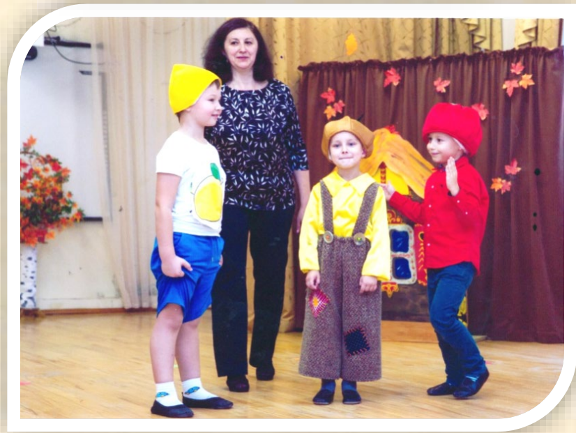
Подготовительная группа «Чиполлино»