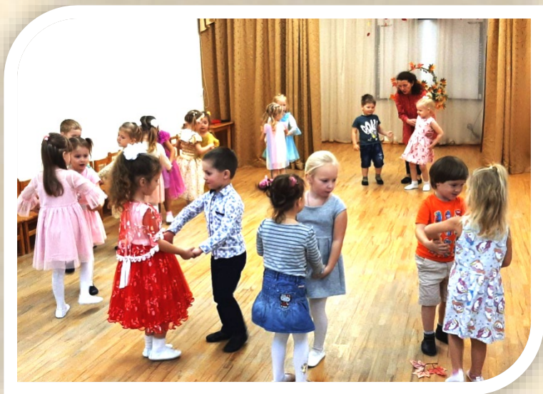
Средняя группа «Полечка»