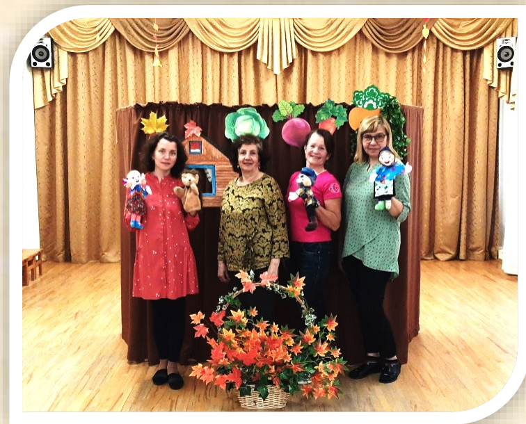
Наши педагоги - настоящие артисты