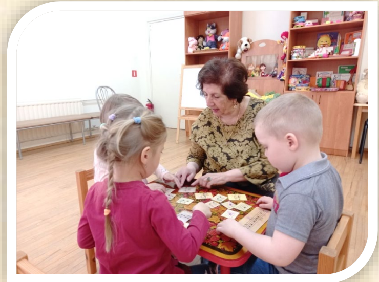
«Музыкальное лото», средняя группа