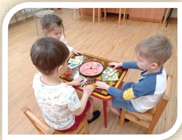
«Волшебный волчок», средняя группа