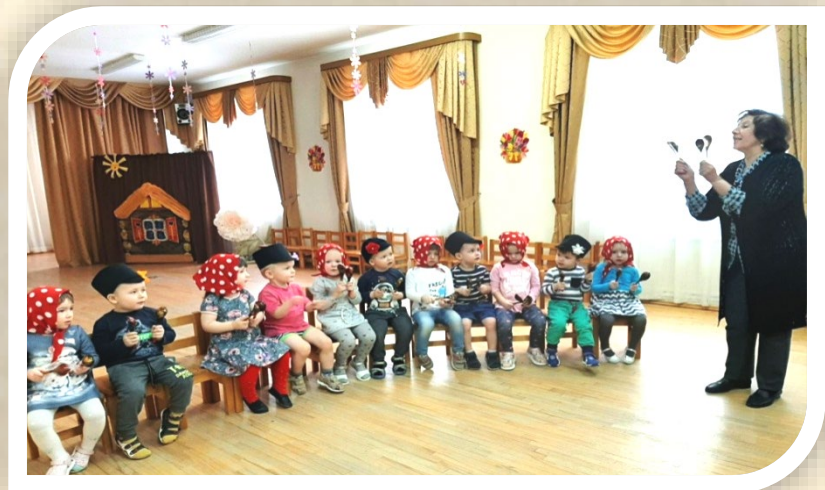
Игра на ложках

В нашем детском саду большое внимание уделяется фольклорным досугам. Дети знакомятся с народным творчеством через песни, танцы, игры