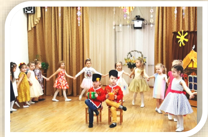
Средняя группа. Играй гармонь