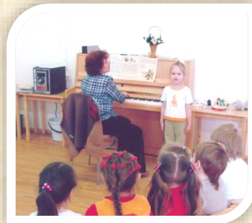
Средняя группа. Соло