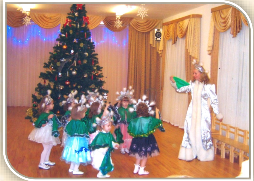
Младшая группа «Танец елочек»