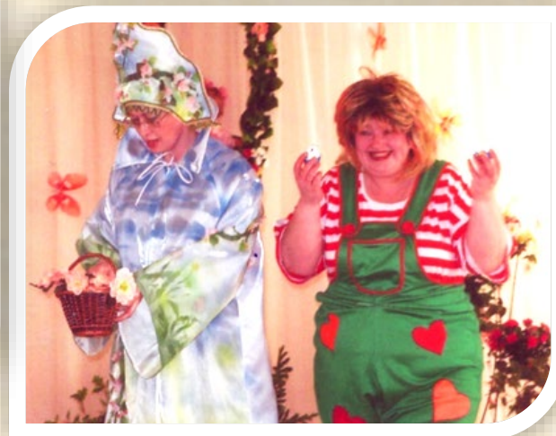
Карлсон с гостинцами на празднике Весны