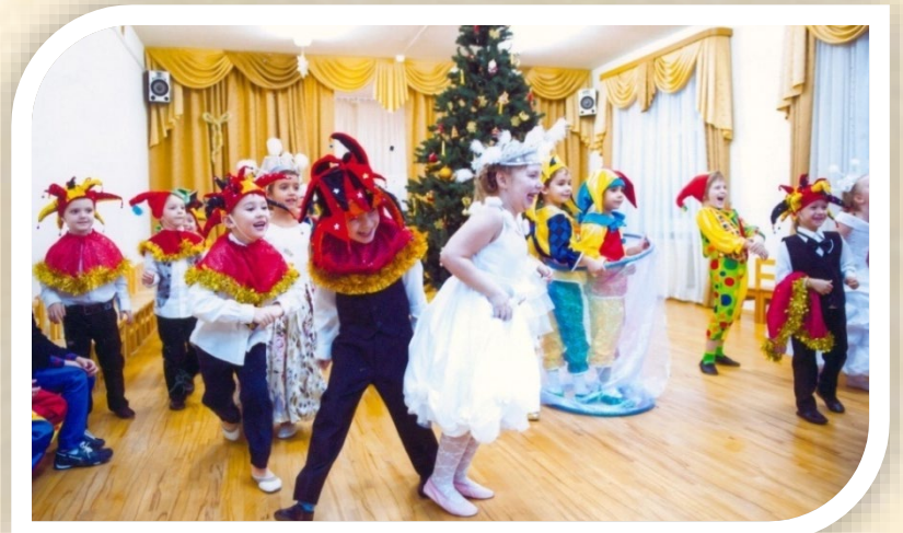
Старшая группа «Новогодний Карнавал»