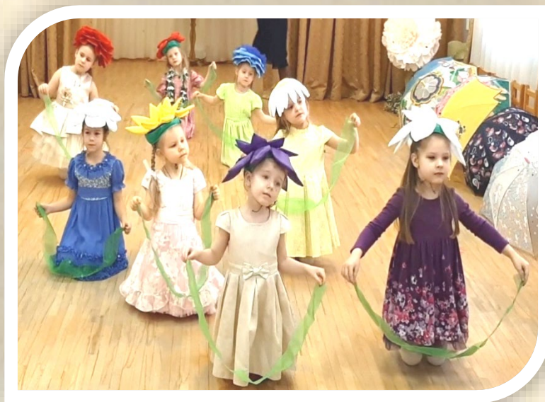
Старшая группа «Вальс цветов»