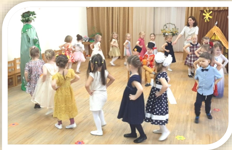
Средняя группа. Мы Весну встречаем