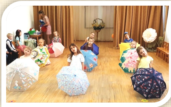
Старшая группа. Танец с зонтиками