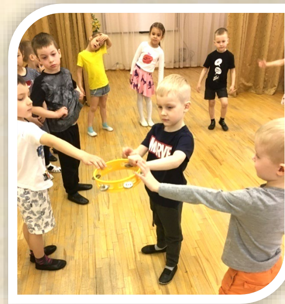
Игра с бубном «Кто быстрее»