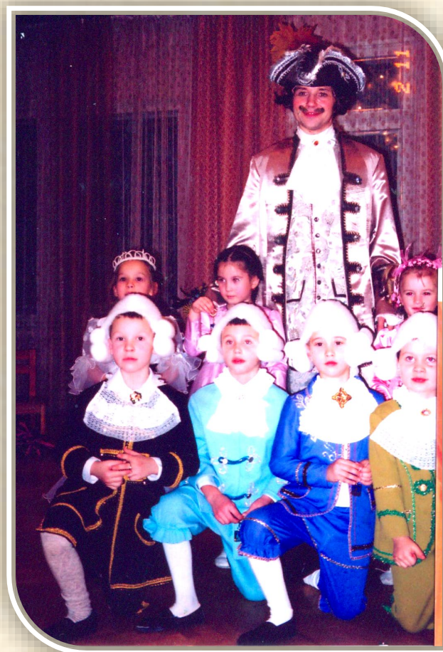
Петербургская ассамблея. Подготовительная группа