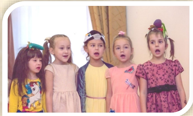
Подготовительная группа. Хоровое пение объединяет детей

В пении успешно формируется весь комплекс музыкальных способностей: эмоциональная отзывчивость, музыкально-слуховые представления, чувство ритма