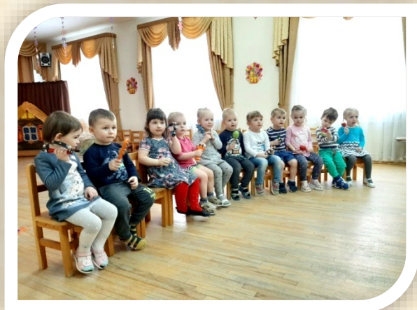
Группа раннего возраста. Знакомство со звучанием

В нашем детском саду большое внимание уделяется музыкальному развитию детей, начиная с раннего возраста. Музыка - это источник особой детской радости. Ребенок открывает для себя ее красоту, ее волшебную силу, а в различной музыкальной деятельности раскрывает себя, свой творческий потенциал