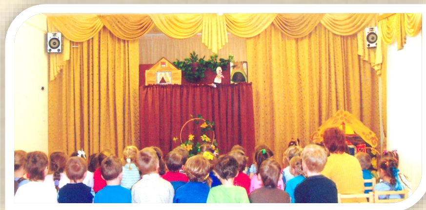
Кукольный спектакль по сказке «Теремок»