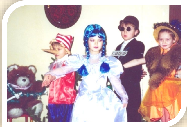
Подготовительная группа «Приключения Буратино»

Театрализованная деятельность в детском саду дает возможность детям познавать окружающий мир, помогает дошкольникам строить взаимодействие друг с другом