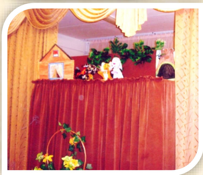
Кукольный спектакль по сказке «Лисичка со скалочкой»