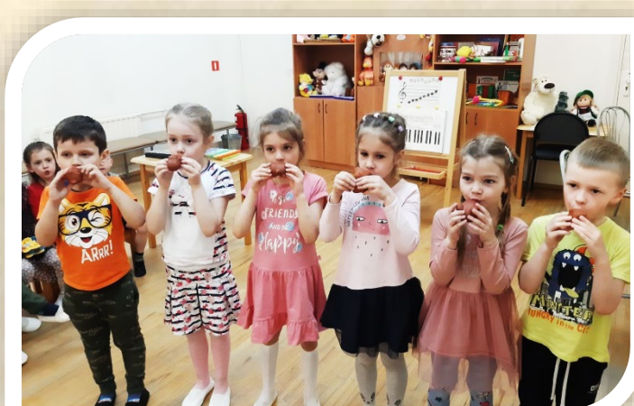
Старшая группа. Подготовка к досугу