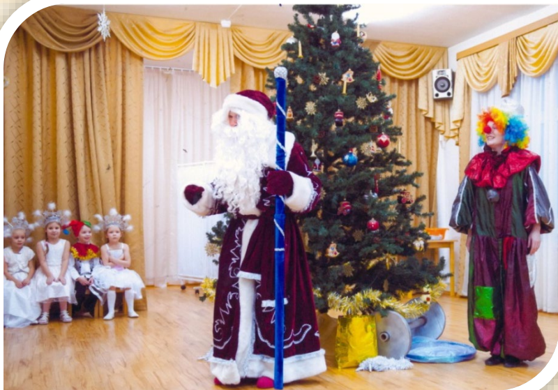
Главный гость на празднике