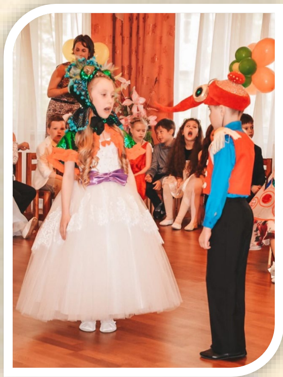
«Муха-Цокотуха», подготовительная группа