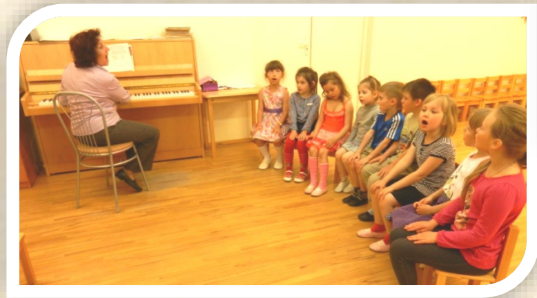
Подготовительная группа. Разучиваем песни к спектаклю