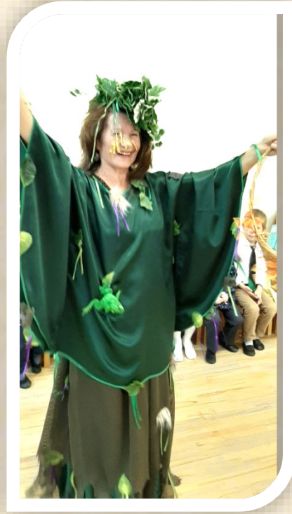
Старшая группа. Кикимора очень любит поиграть с ребятами