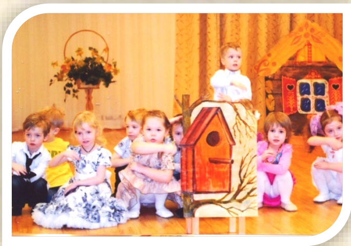
Младшая группа «Скворушки»

Помимо эстетического воспитания, танец помогает формировать математические и логические представления ребенка, навыки ориентировки в пространстве