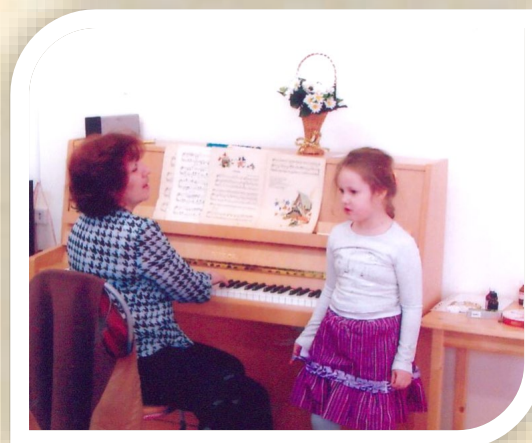
Старшая группа. Индивидуальная работа