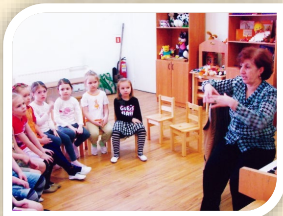
Средняя группа. Знакомство с новым музыкальным произведением