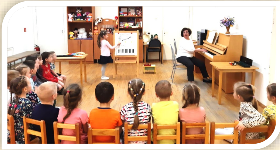
«Где живут ноты», подготовительная группа