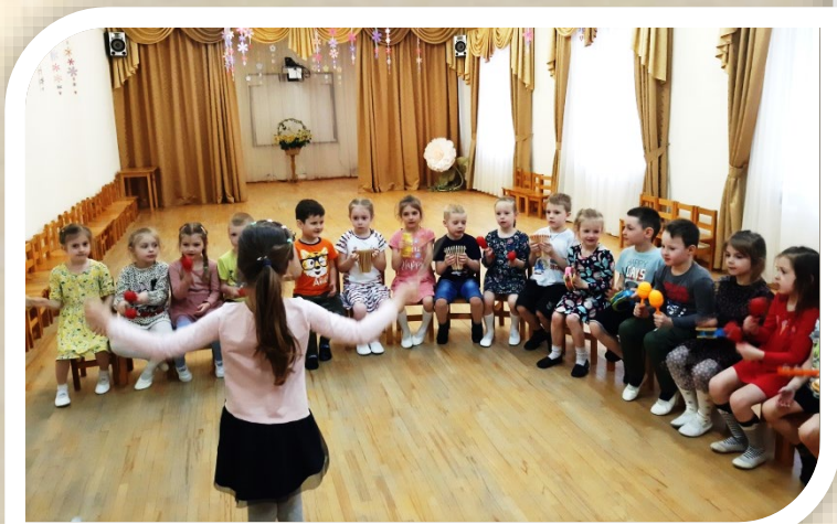
Подготовительная группа. Игра на маракасах