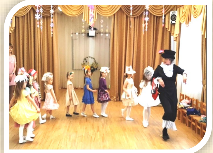
Старшая группа. Дефиле шляпок с Шапокляк