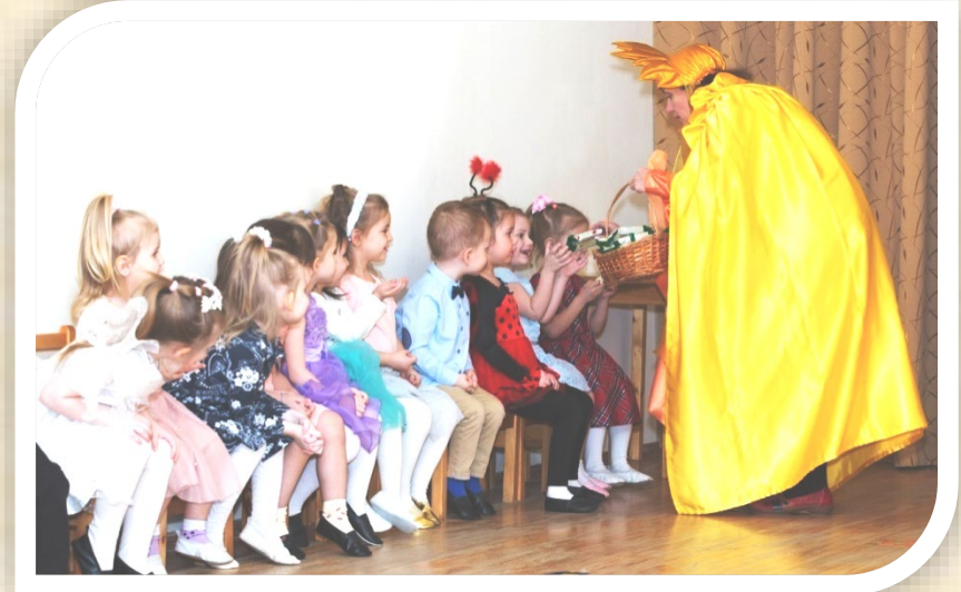
Младшая группа. Солнышко на празднике весны не с пустыми руками