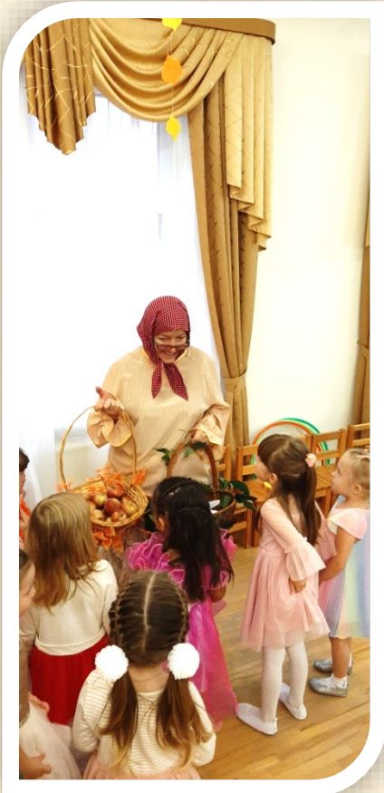
Средняя группа. Бабушка- Забавушка принесла ребятам осенние гостинцы

Традиционно на каждый праздник мы приглашаем сказочных гостей. Наши педагоги, создавая яркие образы, дарят детям радость и хорошее настроение