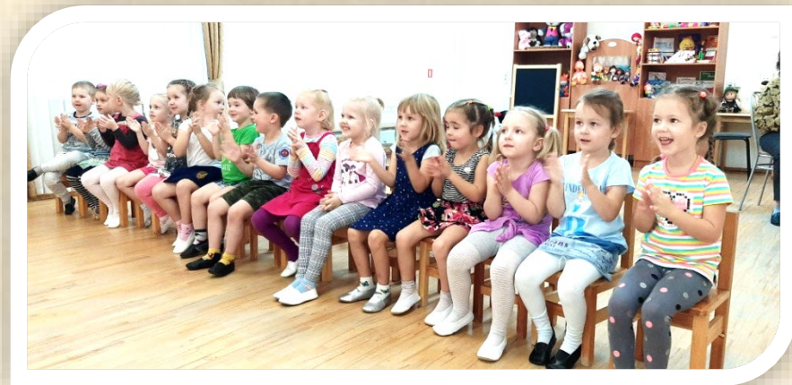
Кукольный спектакль по мотивам русской народной сказки «Пых»